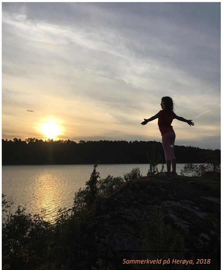
Sommerkveld på Herøya, 2018

Vedtatt i kommunestyret xx.xx.2019, sak xx/xxx