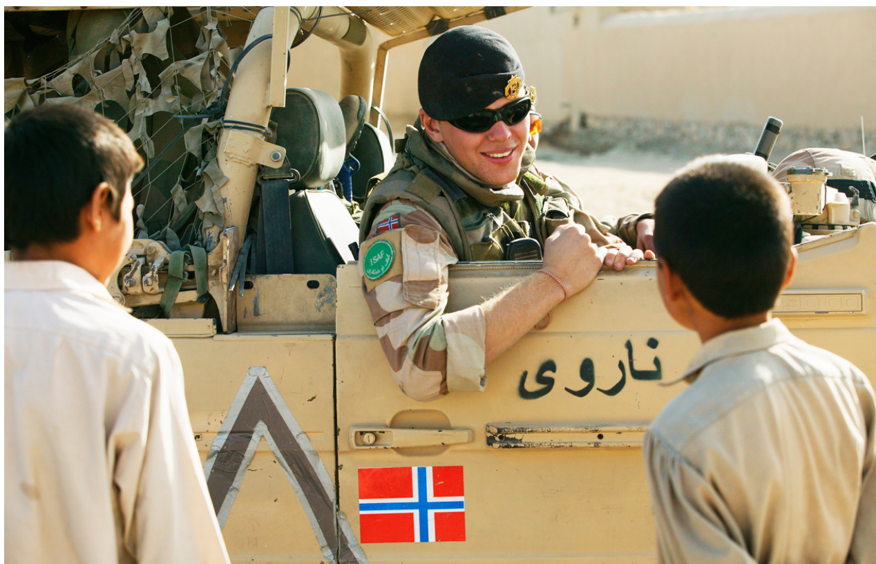
Bilde: Norske soldater i felt .