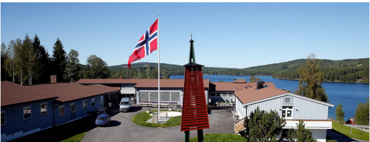
Bilde: Forsvarets veteransenter på Bæreia.

Åpen dør består av et tverrfaglig team med både militært og sivilt ansatte. Teamet har lang erfaring med å gi råd og veiledning til veteraner og deres familier. De fleste i dette teamet er også selv veteraner fra internasjonale operasjoner.