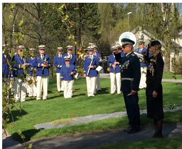
Bilde: 8. mai markering i Nordre park i Hønefoss.