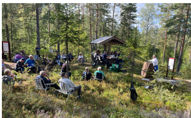
Bilde: Fra Grencelledagen, Eiker, Modum og Sigdal forsvarsforening.

Veteran- markeringene må utvikles i spenningen mellom tradisjoner og fornyelse.