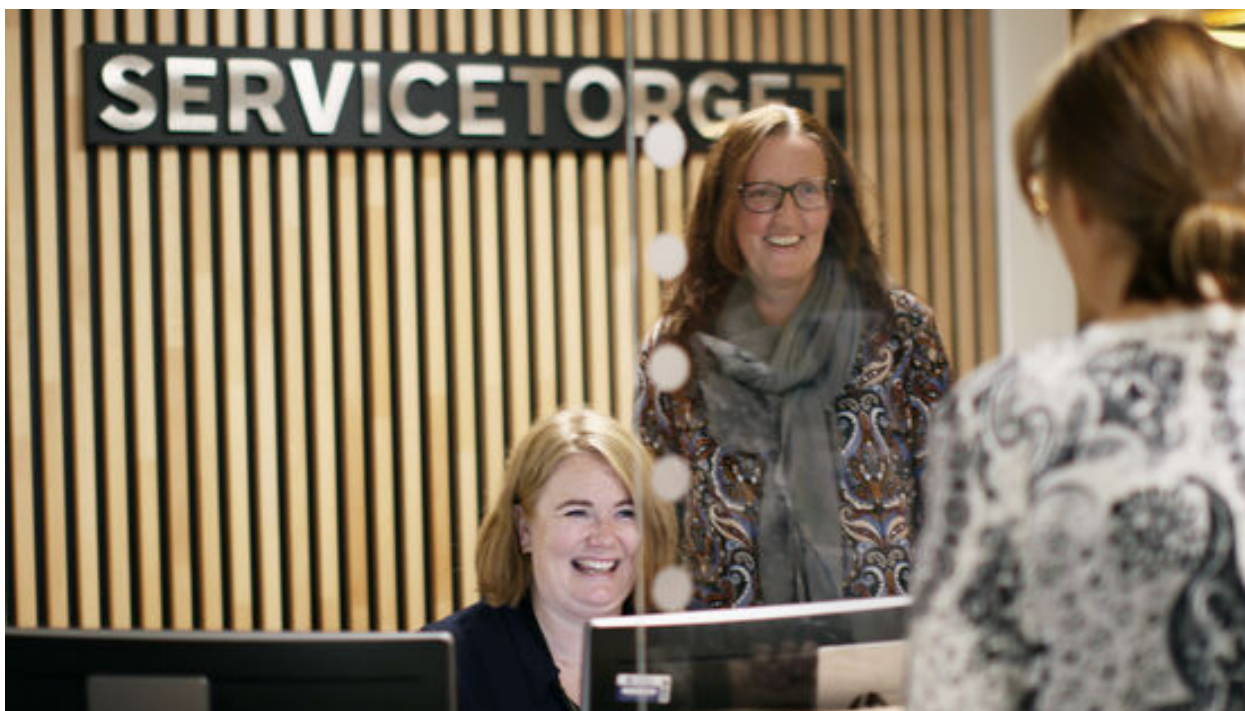
Bilde: Servicetorget i Jevnaker kommune.