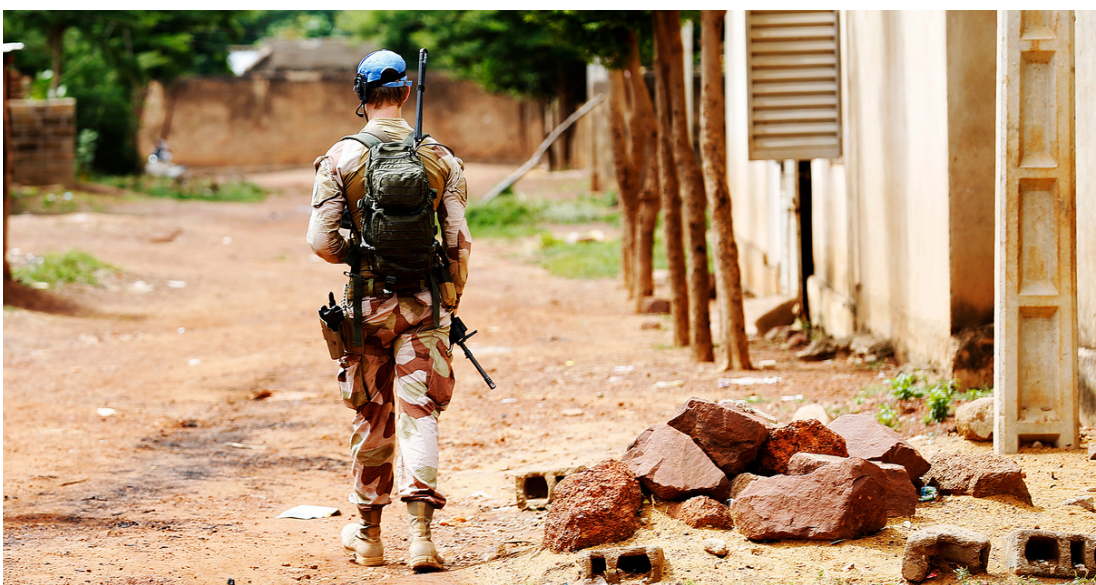
Bilde: Norsk soldat i felt.

Et overordnet prinsipp er at skadet og traumatisert personell skal følges opp av de ordinære helse-, omsorgs- og sosialtjenester. Traumer og skader som veteranene kan ha vært utsatt for setter høye krav til kompetansen i de ordinære tjenestene. Utfordringene er sammensatte og komplekse.