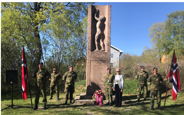
Bilde: 8. mai markering, Heggeni Modum.

I dag er det nesten ingen som er med på 8. mai-markeringene som selv deltok under andre verdenskrig. Dagens markeringer må derfor treffe alle fra de som tjenestegjorde i Tysklandsbrigaden, eller under Koreakrigen rett etter 2. verdenskrig, til våre veteraner som er kommet hjem fra blant annet Bosnia, Irak, Libanon, Afghanistan, Tsjad og Sør-Sudan.