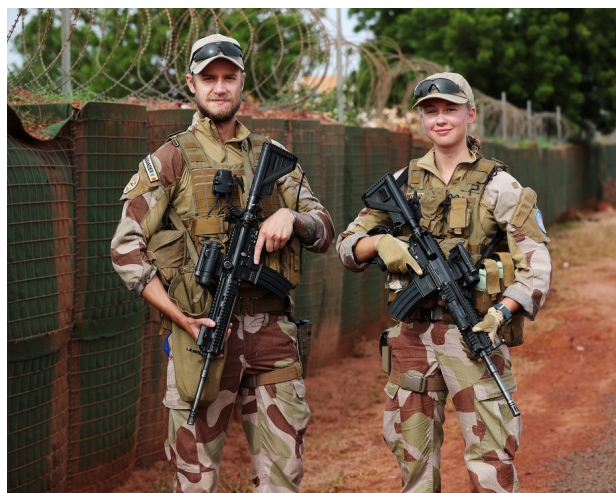
Bilde: To norske soldater.