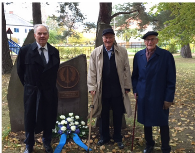
Bilde: Markering av FN-dagen.

Er viktig for at veteraner skal møte likemenn, bygge nettverk, delta på lokale møteplasser og bidra i aktiviteter og ved arrangement.