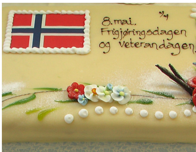
Bilde: 8. mai er frigjøringsdagen og veterandagen.