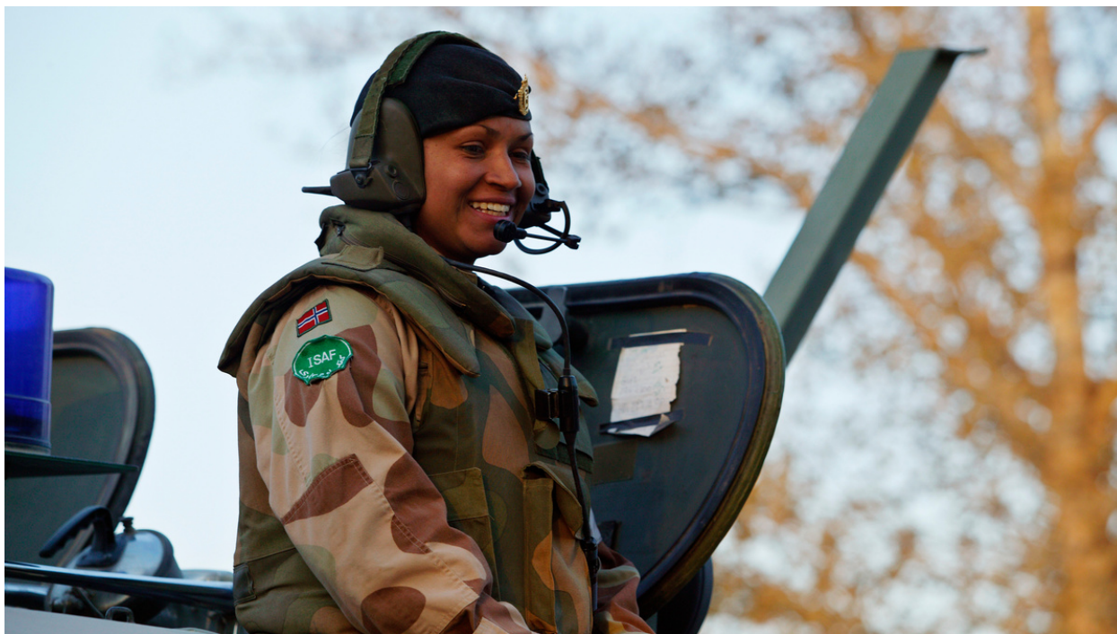
Bilde: Norsk soldat i felt.

Tall fra Forsvaret tilsier at det er om lag 850 veteraner i Ringeriksregionen per. 2022.