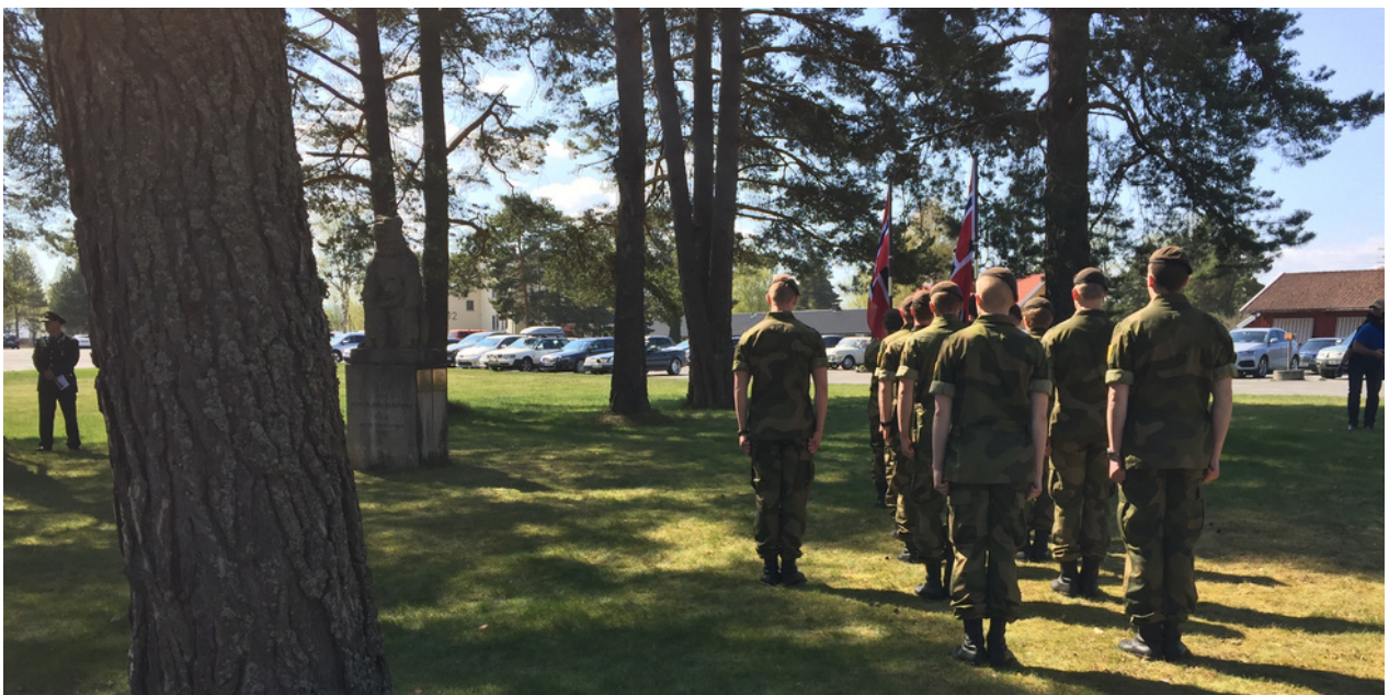
Bilde: 8. mai markering på Helgelandsmoen i Hole kommune.

Helgelandsmoen og Hvalsmoen var mobiliseringsplasser for de norske styrkene da andre verdenskrig brøt ut i 1940.